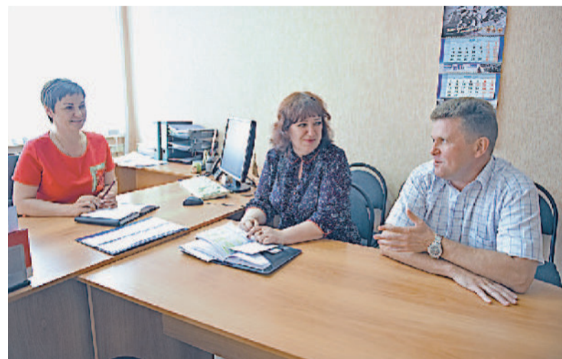
РУКОВОДСТВО ОТДЕЛА. Решая производственные задачи.

конкуренции, ценовой политики компании, рекламной поддержки,