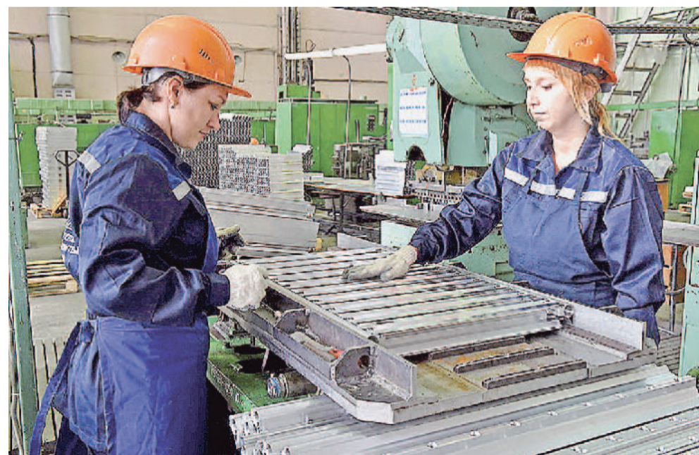
На сборке радиаторов «Термал».