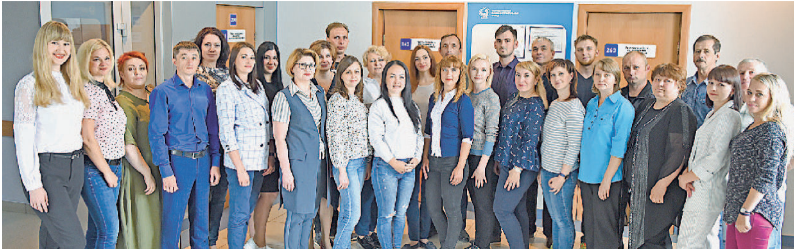
Коллектив отдела № 218.