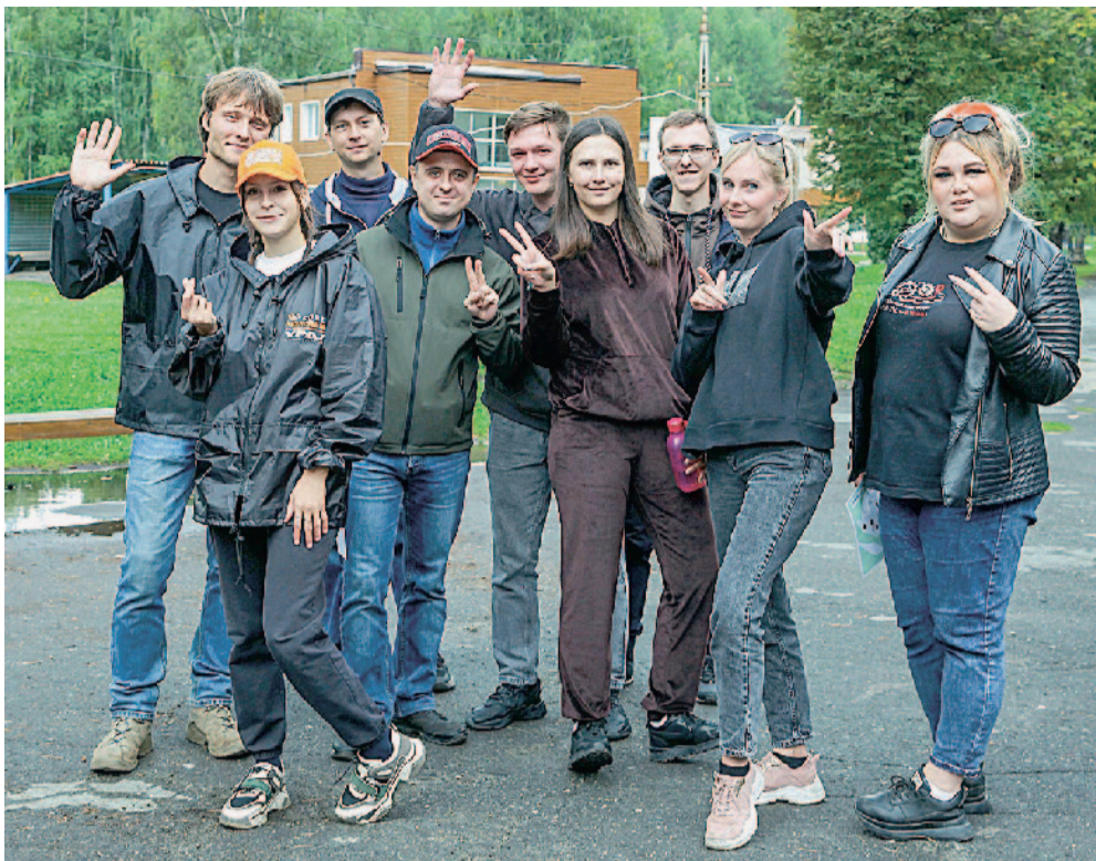
Молодые! Активные! Инициативные!

Представители Совета работающей молодежи АО «Златмаш» приняли участие в X слете Совета молодых специалистов АО «ГРЦ Макеева», который состоялся в первых числах сентября на базе Центра загородного отдыха им. Феди Горелова.