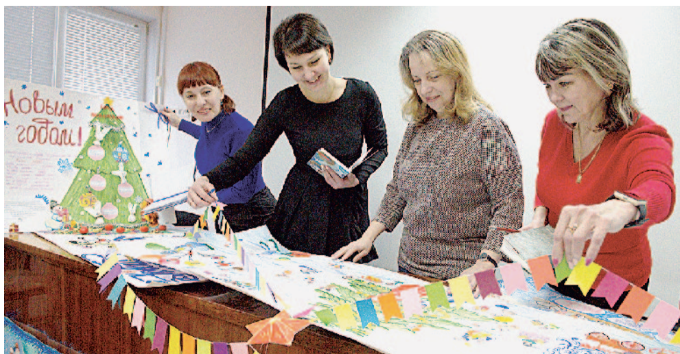
Работами жюри осталось довольно!