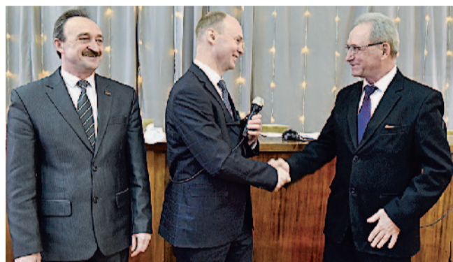
На итоговом совещании