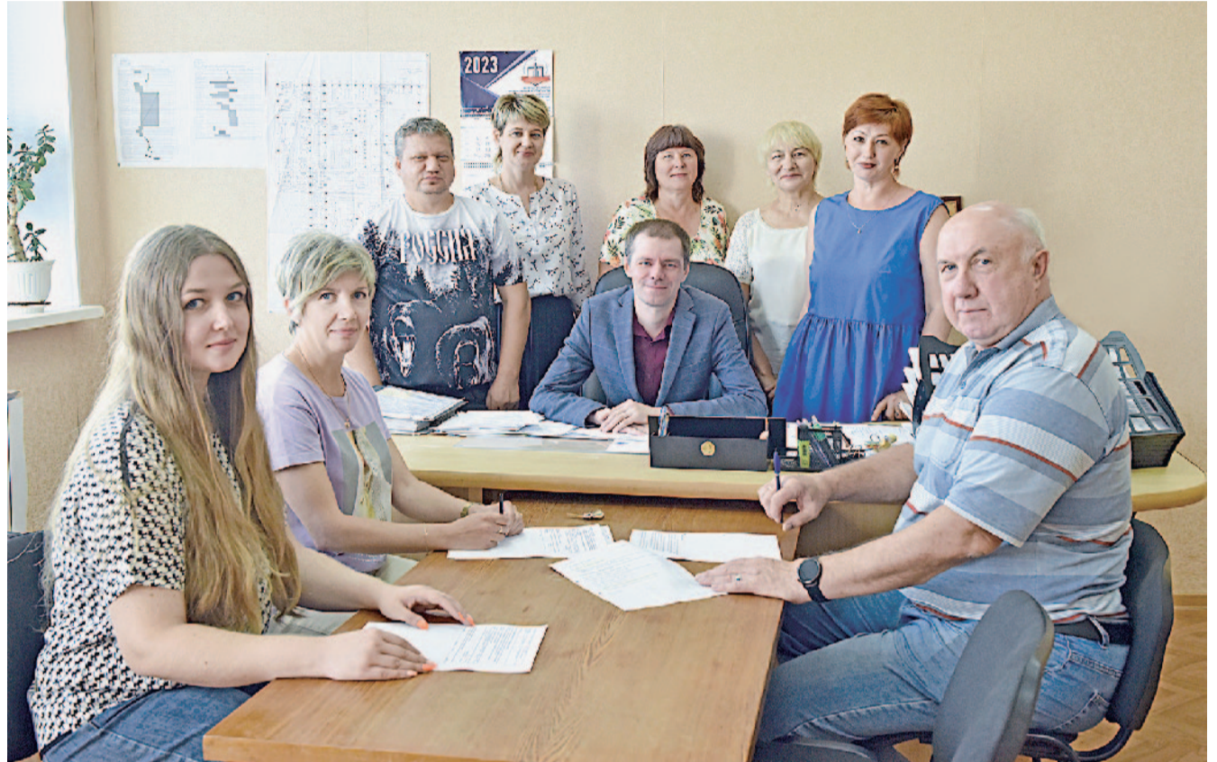
Коллективы отдела № 219 и цеха № 299