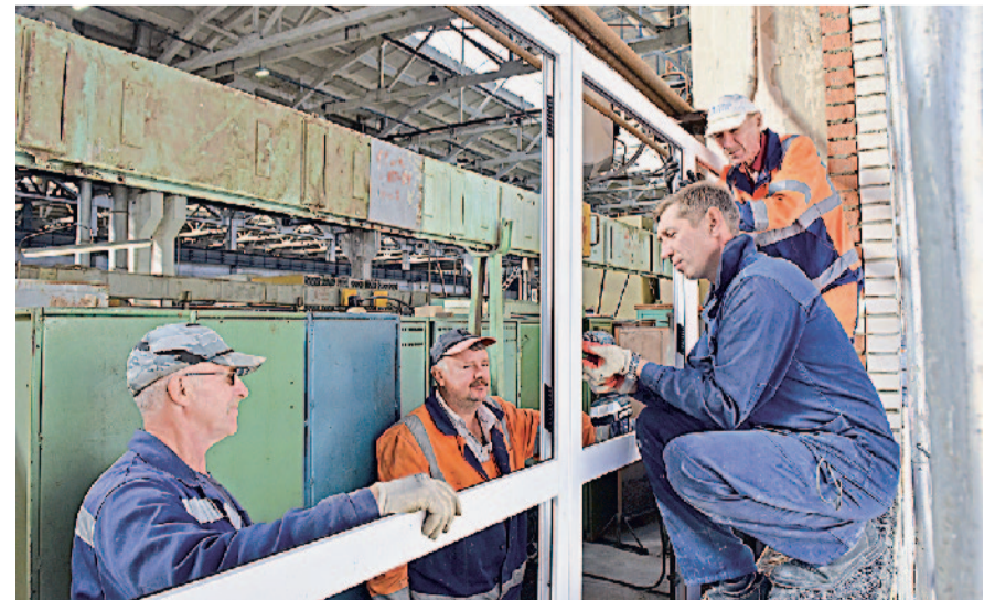
Сотрудники цеха № 299 проводят установку стеклопакетов