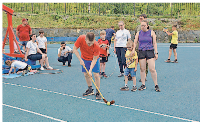
В АО «Златмаш» популярны спортивные праздники

9. Американские пловцы признавались советскому пловцу Владимиру Сальникову, что одно время использовали его фото в качестве НЕЕ. ЕЕ стандартный диаметр составляет сейчас 451 мм. Назовите ЕЕ абсолютно точно.